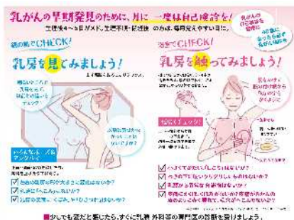
▲乳がんセルフチェックカード

自己検診方法を記載した「乳がんセルフチェックカード」を全国の生協で配布しています。