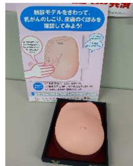
▲乳がん触診モデル