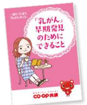
▲乳がんに関する情報冊子

乳がんの予防のための情報や、女性のもしもの際にお役に立てる保障内容を掲載している小冊子を全国の生協で配布しています。